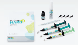
バルクベース®ハードⅡ セット

低重合収縮性と高い硬化性を有し、積層充填なしに一括で裏層に必要な厚みを確保できます。機械的物性や耐摩耗性も高いため、最表面まで一括充填できます。