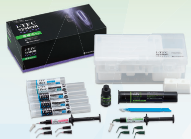
i-TFC®システム 直接法セット

ファイバーポスト・コア「i-TFCシステム」！「光ファイバーポスト」の使用で根管深部のレジンまでしっかりと重合硬化します。また、「アクセサリーファイバー」や「スリーブ」の併用により曲げ強度が向上し、築造体の補強効果が期待できます。