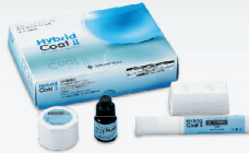
ハイブリッドコート®Ⅱ セット

形成後の生活歯を外来刺激や二次う蝕から守るシーリング・コーティング材です。露出した象牙質表面に対しては良質な樹脂含浸層と一体化した被膜を形成します。