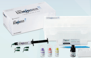
i-TFC®ルミナスII スターターセット

ファイバーポスト・コア「i-TFCルミナスII」シリーズ*！ 光透過性の高い光ファイバーで根管深部のレジンまでしっかり重合します！審美性に優れた国内生産のファイバーポストコアシステムを是非ご体感ください。