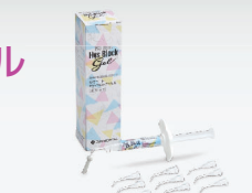
MSコート®Hysブロック®ジェル

ダイレクト塗布でこすり塗り不要の知覚過敏抑制材料です。フッ化ナトリウムによる耐酸性効果で、適用歯面の酸による脱灰を抑制します。