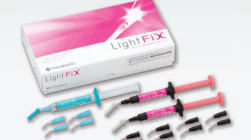
ライトフィックス® セット

ワンペーストで光硬化型の動揺歯固定用接着材料です。外傷固定や軽度の膿漏固定など、治療スピードが求められる動揺歯固定に適しています。