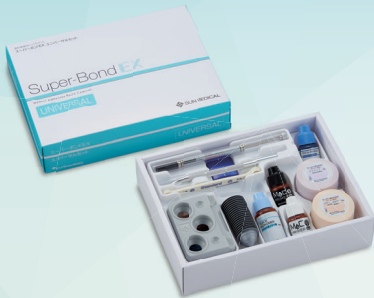
スーパーボンド®EX ユニバーサルセット

使いやすさが進化した「スーパーボンド」！1982年の発売以来、基本組成を変えることなく、構成品や付属品の追加・変更等で大幅に操作性を改良してきました。CAD/CAM冠接着にも対応した「スーパーボンド」を是非実習で体感してください。