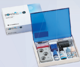
ボンドフィルSB®II セット