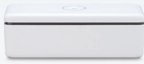
クレイキープ™ ライト

義歯やマウスガードなど、樹脂製口腔内装置へのブランク付着抑制効果を持つコーティングシステムです。