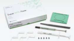
スーパーMTAペースト™ セット

「スーパーMTAペースト」は、重合開始剤に「TBB」を用いた「Resin-modified MTA」です。露出した非感染生活歯髄に用いることにより外来刺激から歯髄を保護します。