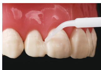
動揺歯固定での 隣接面への塗布