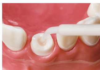
ポストホールへの注入