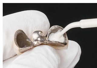
ブリッジ内冠への注入