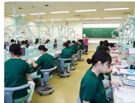
歯科衛生士学校での授業風景