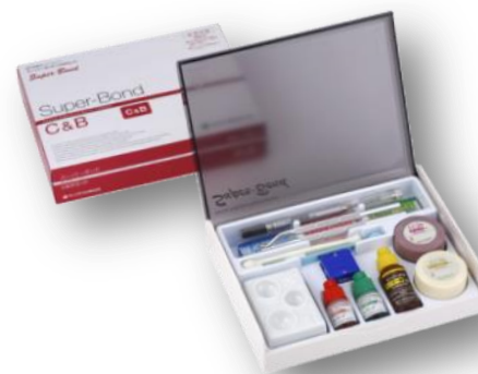
主力製品 スーパーボンド