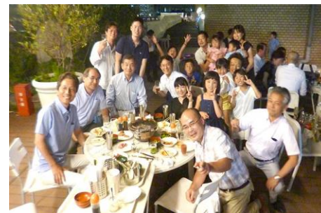
毎年恒例の納涼祭