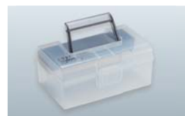
i-TFCシステム 収納ケース(単品) ¥900